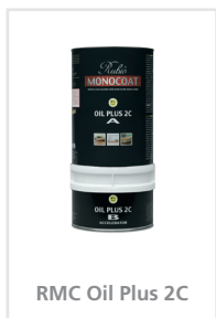
RMC Oil Plus 2C