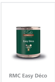
RMC Easy Déco