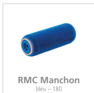
RMC Manchon bleu - 180